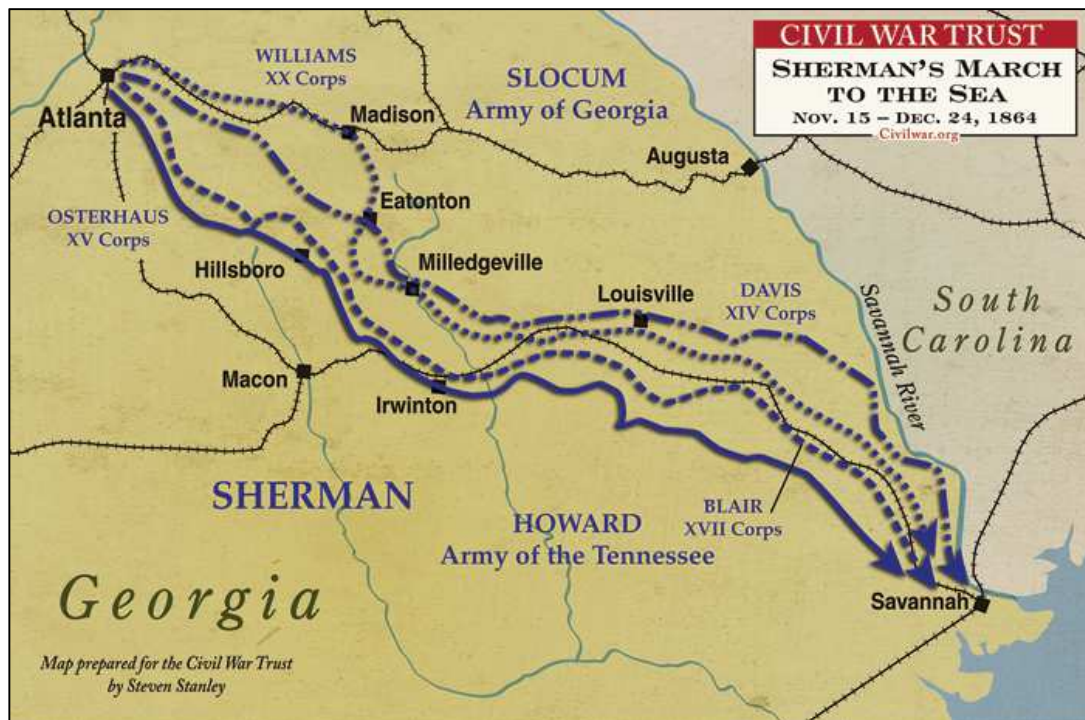
Carte 5- Itinéraire de Sherman entre Atlanta et Savannah

Sherman divise son armée en deux ailes, qui doivent chacune emprunter deux routes parallèles. Il espère ainsi cacher le plus longtemps possible sa destination finale, en faisant croire à un possible mouvement vers Augusta (un centre manufacturier important, et principal centre de fabrication de poudre pour le Sud), au nord de Savannah 60 , soit plus au Sud vers l'Alabama.